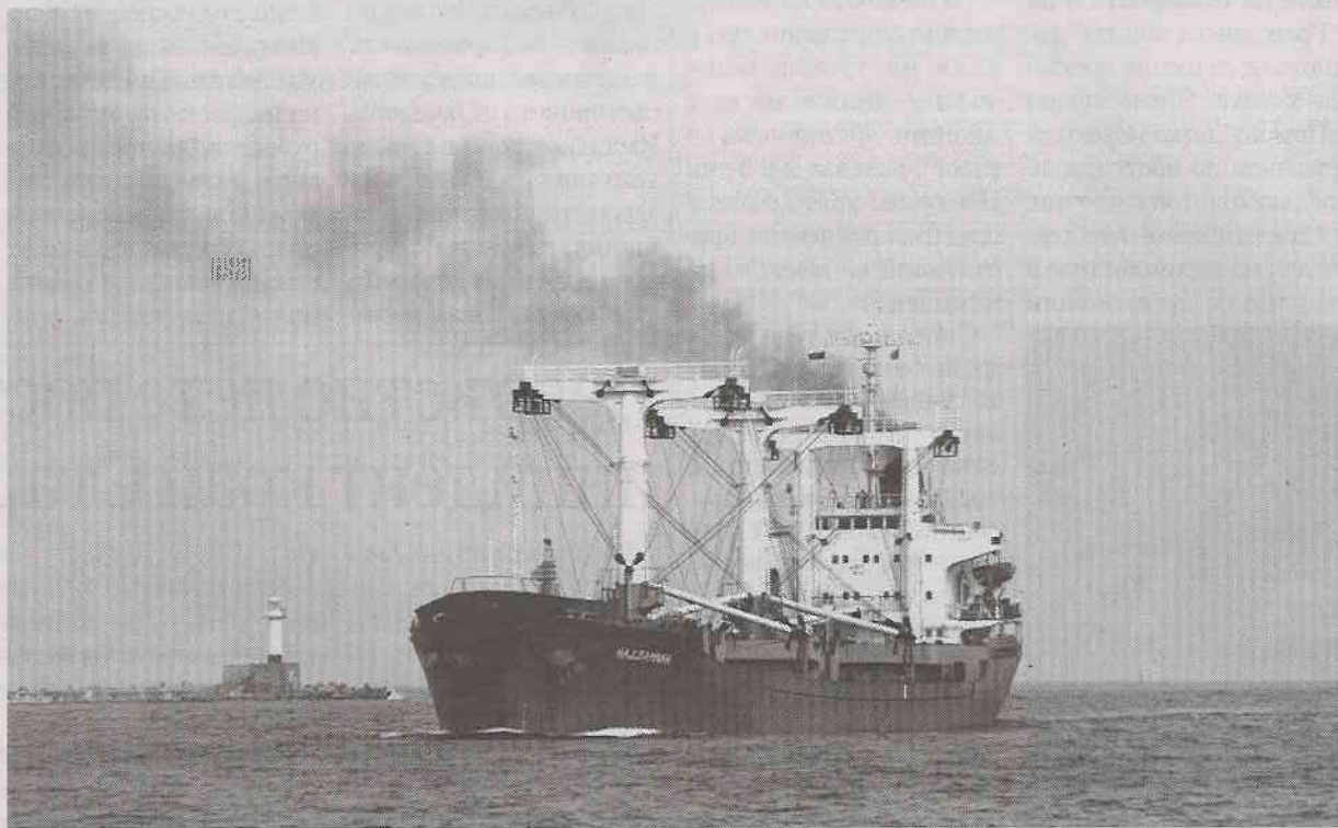
ЗАДЪЛБОЧАВА СЕ дефицитът на офицерски кадри за корабите.